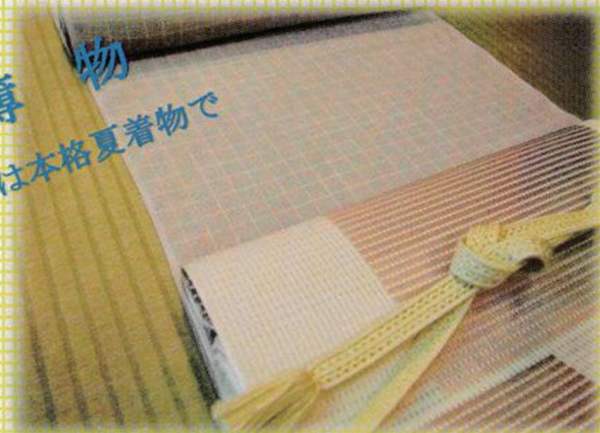
きもの：紗格子 帯：博多織

すける魅力いっぱい盛夏の装い 見るからに涼やかな、 そして個性的でスツキリした コーディネートをご提案します